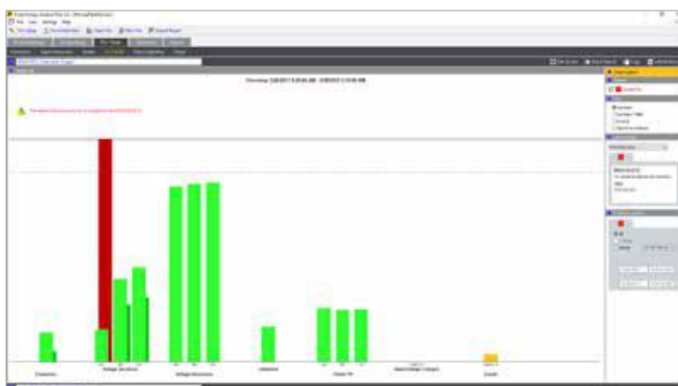
Fluke Energy Analyze Plus: Resumo do estado de saúde da qualidade da potência