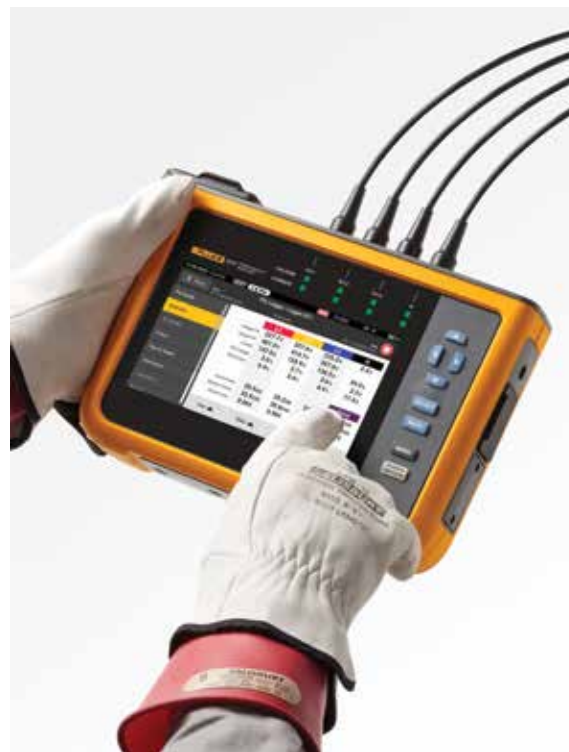
Navegue facilmente através do ecrã tátil a cores de grandes dimensões

Ao transferir dados dos analisadores de qualidade de potência da série Fluke 1770, o pacote de software Energy Analyze Plus incluído pode comparar os dados estatísticos medidos de tensão e de harmónicos de corrente com as exigências de diferentes normas como, por exemplo, a EN 50160 ou a IEEE 519, para determinar se excedem os limites de conformidade. Esta potente funcionalidade de manutenção preditiva permite que os harmónicos de corrente sejam observados antes de surgir distorção na tensão, o que permite evitar falhas inesperadas ou situações de não conformidade e aumentar o tempo de atividade do sistema. Com a proliferação de cargas e geração de energia baseadas em inversores, manter os harmónicos de corrente sob controlo está a tornar-se cada vez mais vital para garantir uma qualidade fiável da potência e evitar tempo de inatividade do sistema.